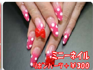
ミニネイル リボンパーツ+¥300