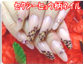
セクシーヒール柄ネイル