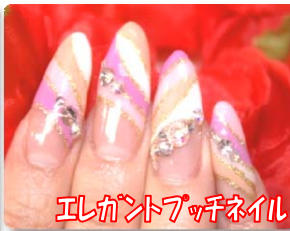
エレガントフツチネイル