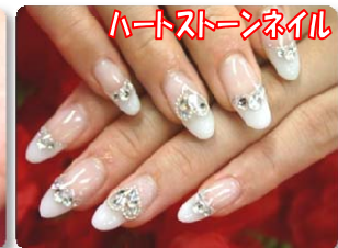
ハートストーンネイル