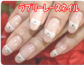
ラフリーレースネイル